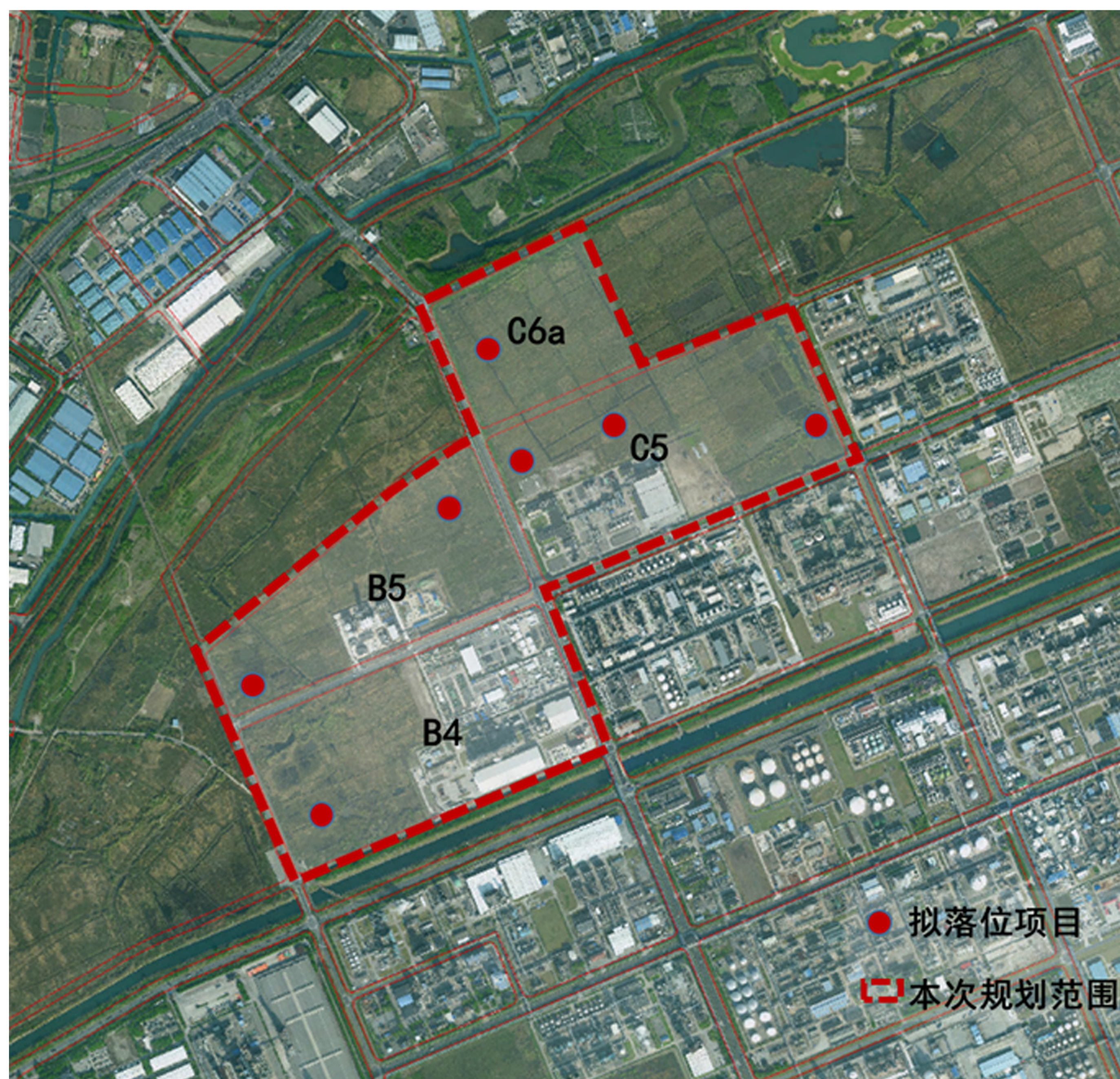
相关街坊与拟落位项目在上海化学工业区的位置