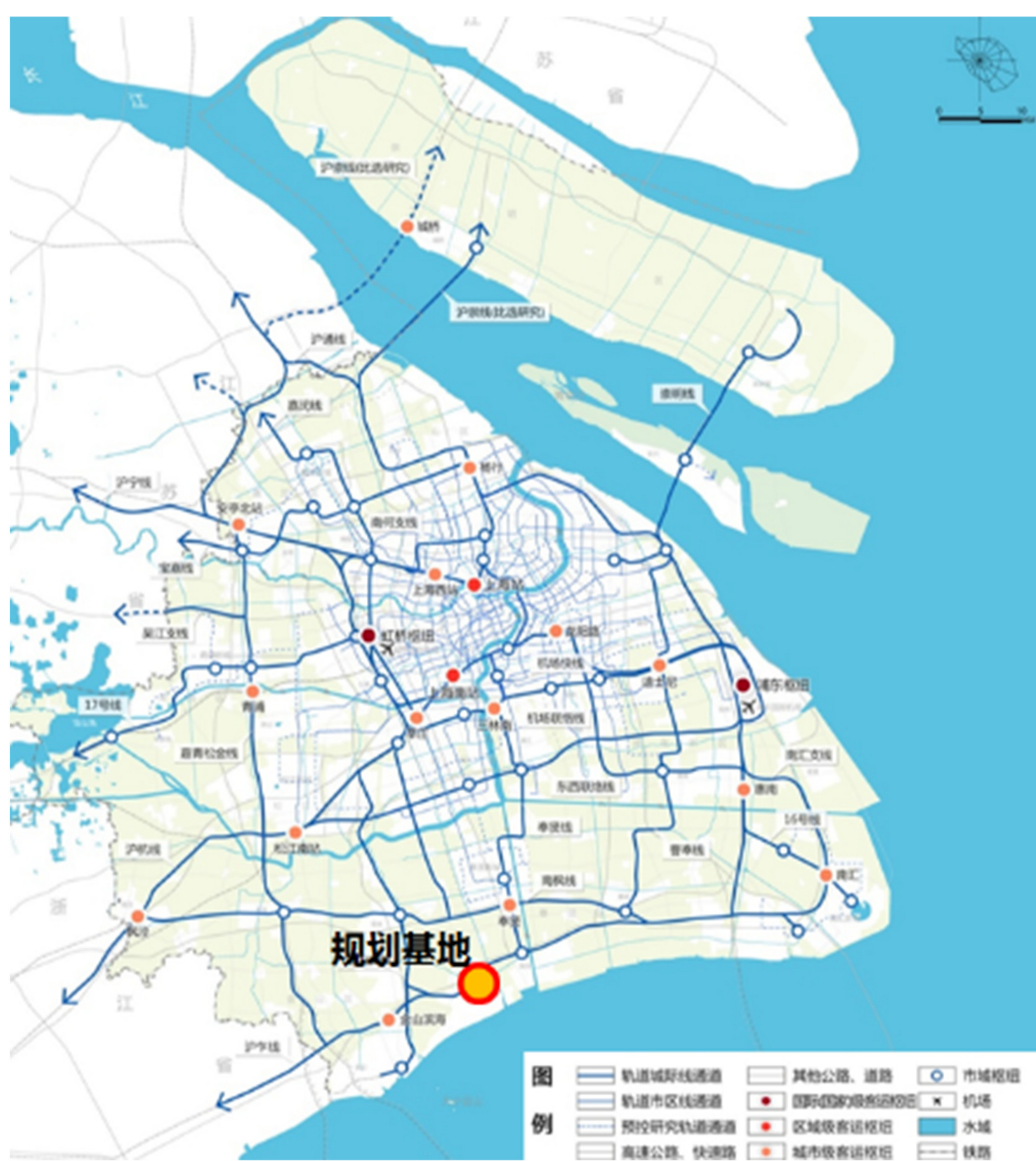
上海化学工业区在上海市的位置

为积极落实上海市政府常务会议审议通过的《上海电子化学品专区三年行动方案》，加快推进上海电子化学品专区和尼龙一体化产业基地建设，保障相关产业项目落地，开展本次控制性详细规划实施深化。